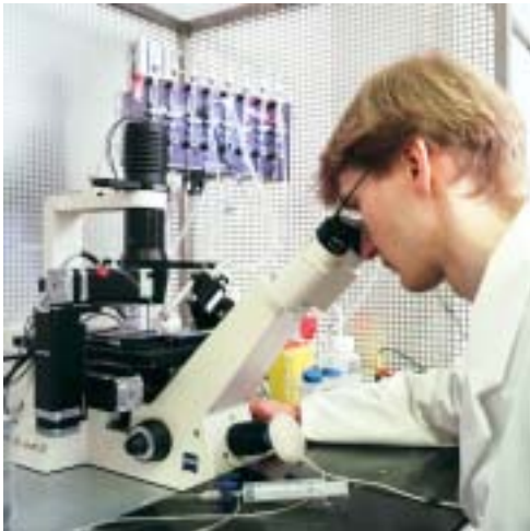
Auch klassische elektrophysiologische Untersuchungen gehören zum Service-Angebot von IonGate.