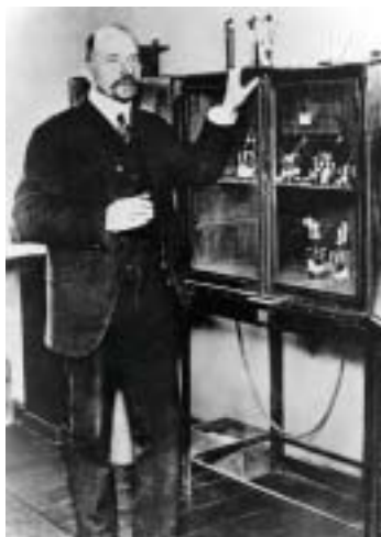
Der Forscher und Unternehmer Emil von Behring.

Wer über Impfstoff spricht, denkt zu Recht an die Behringwerke. 1895 wurde der 1854 in Westpreußen geborene Mediziner Emil von Behring als Direktor des Hygiene-Instituts und akademischer Lehrer nach Marburg berufen. Für seine hier geleisteten Forschungen erhielt er im Jahre 1901 den ersten Nobelpreis für Medizin. Damit wurde seine bahnbrechende Arbeit im Bereich der Serumtherapie gegen die Diphtherie gewürdigt. Behring investierte die zwei Millionen Mark des Nobelpreises und gründete 1904 das „Behringwerk“. Damit schuf er die Basis für ein Weltunternehmen der Pharmazie. Der Wissenschaftler wäre in diesem Jahr 150 Jahre alt geworden.