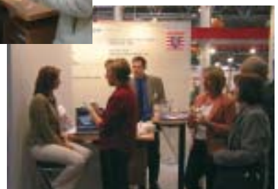
Impressionen vom Gemeinschaftsstand Hessen auf der Medica 2004