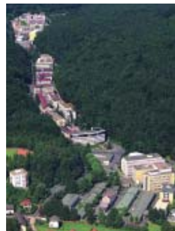
Das Hauptwerk des Standorts Behringwerke.

Weltunternehmen ZLB Behring, Chiron Vaccines und Dade Behring für die Forschung und Entwicklung zahlreicher Produkte verantwortlich, die von hier aus erfolgreich in alle Welt vertrieben werden. Inzwischen sind hier rund 4.300 Mitarbeiter tätig, die in den Bereichen Biotechnologie und Pharmazie forschen und produzieren.