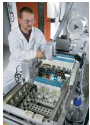
Vollautomatische Apparatur zur Herstellung von Pulverkatalysatoren im Kleinmengenmaßstab.