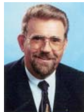
Die Geschäftsführer der Hessen Agentur:

Die im Rahmen der Aktionslinie hessen-biotech bislang von der TechnologieStiftung Hessen angebotenen Dienstleistungen werden nahtlos von der Hessen Agentur fortgeführt.