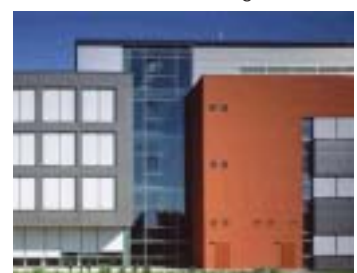
Degussa Kompetenzzentrum für Katalyse in Hanau-Wolfgang.