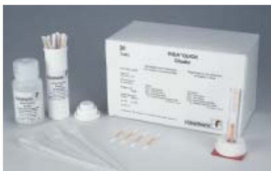
RidaQuick Gliadin-Test zum Nachweis zum Nachweis von Gluten in Getreide