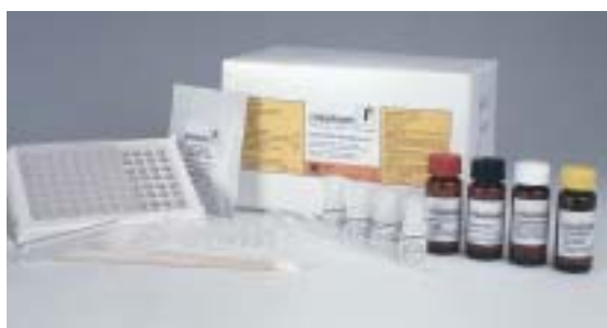
Enzymimmunoassay zur semiquantitativen Bestimmung von Risikomaterial im Fleisch