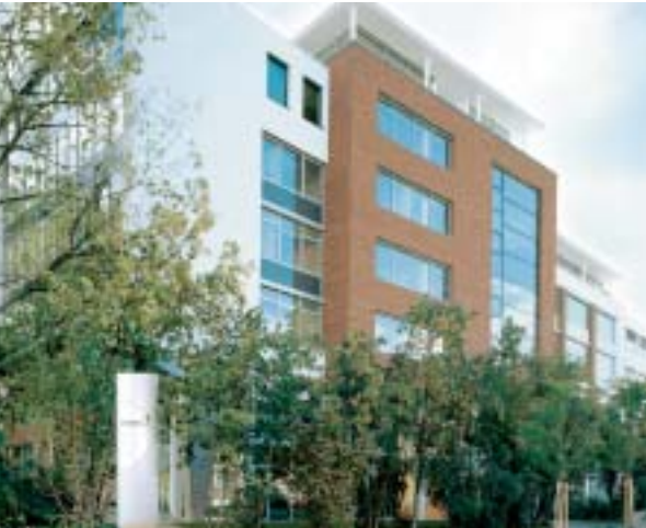
Der Firmensitz von R-Biopharm in Darmstadt